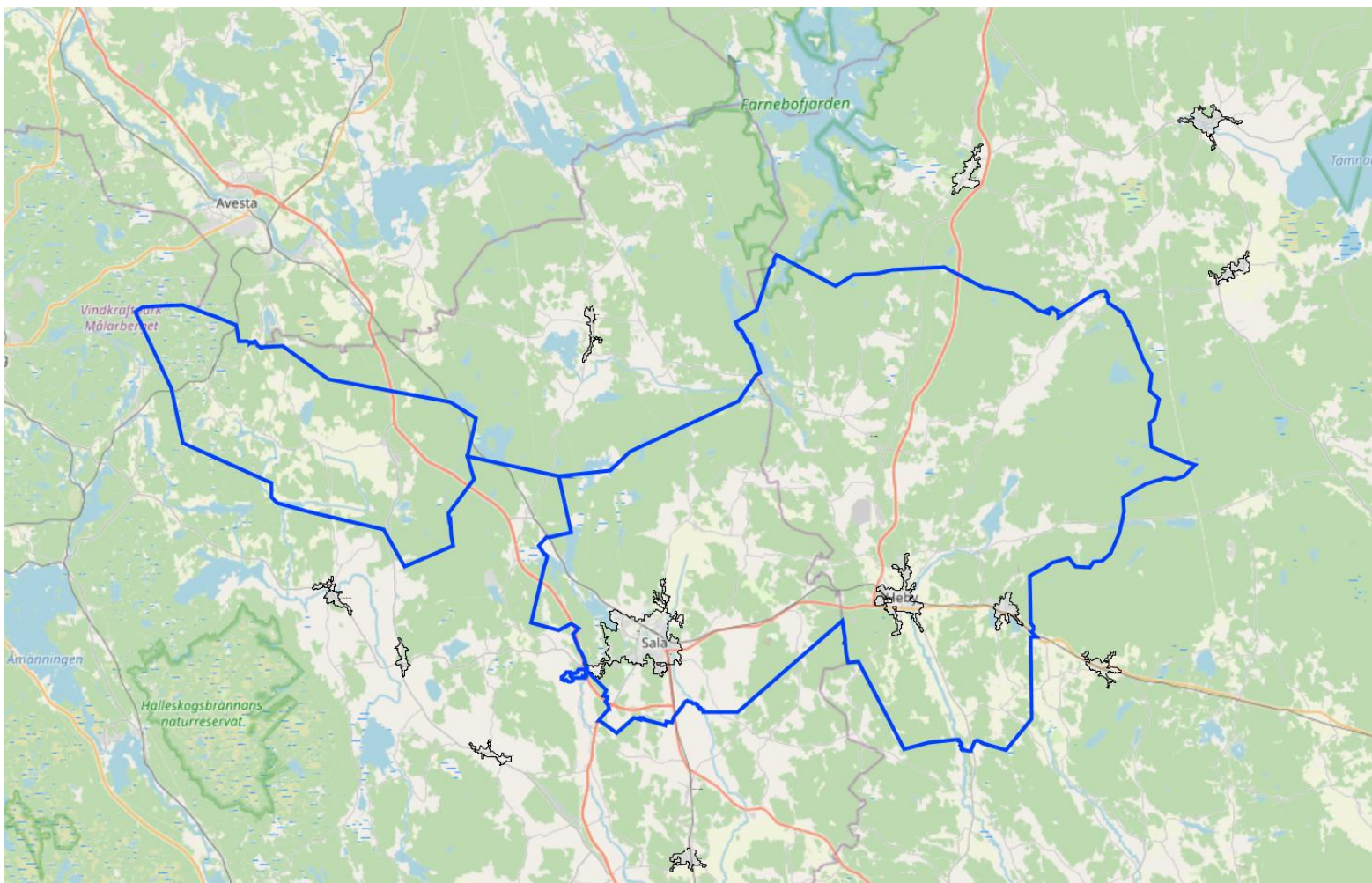
Figur 1. Översiktskarta över Sala-Heby Energi Elnät ABs elnät.